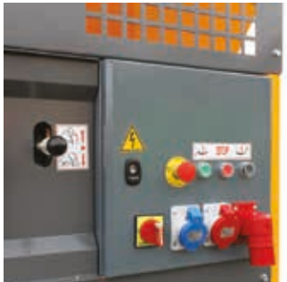
PAINEL DE CONTROLO, VERSÃO ELÉTRICA E DIESEL