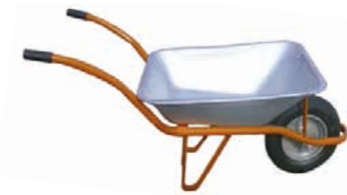
COMPACTO 70L SOLDADO