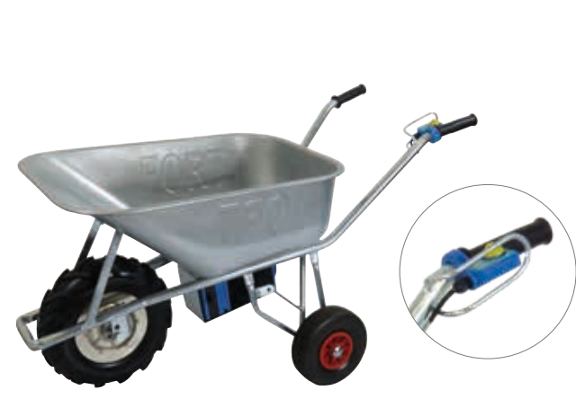
CARRO DE MÃO ELÉTRICO