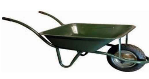
CLASSICO 90L SOLDADO