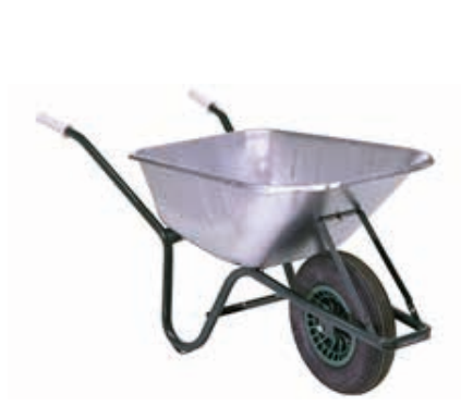
116B-90 90L SOLDADO