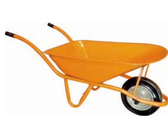
EUROPA 95L SOLDADO