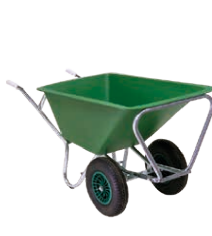
CARRO DE MÃO PEX-160/2

Motor potente Velocidade: -5,5 Km/h marcha à frente – variável -3 Km/h marcha atrás Controlo de velocidade nas descidas (travão) Opção: 2 rodas extra Duração Bateria: 100 min de trabalho contínuo 1 ano de garantia (exceto roda)