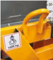
GANCHO DE ELEVAÇÃO

Rotativa hidráulica Balde horizontal Skip hidráulico Balde 800L e reservatório 120L de água Gasolina ou Diesel Versão elétrica trifásica 400v/50HZ Opção: pá de arrasto