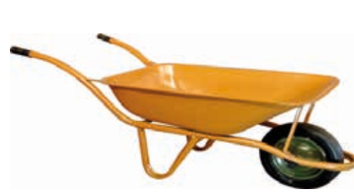
RETANGULAR 80L SOLDADO