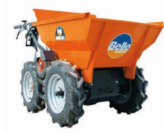
MINI DUMPER BMD300

REF. MC.BMD01 Todo o terreno 2 ou 4 rodas motrizes Capacidade 300 Kg e 134L Largura de 72cm (passa nas portas) Motor Honda GXV 160