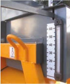
DEPÓSITO DE ÁGUA COM CAPACIDADE DE 60L OU 120L