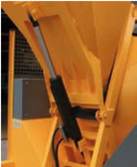
CILINDRO HIDRÁULICO DUPLO-EFEITO COM VÁLVULA DE SEGURANÇA

Rotativa hidráulica Balde Horizontal Skip hidráulico Balde 400L e reservatório 60L de água Gasolina ou Diesel Versão elétrica trifásica 400v/50HZ Opção: pá de arrasto